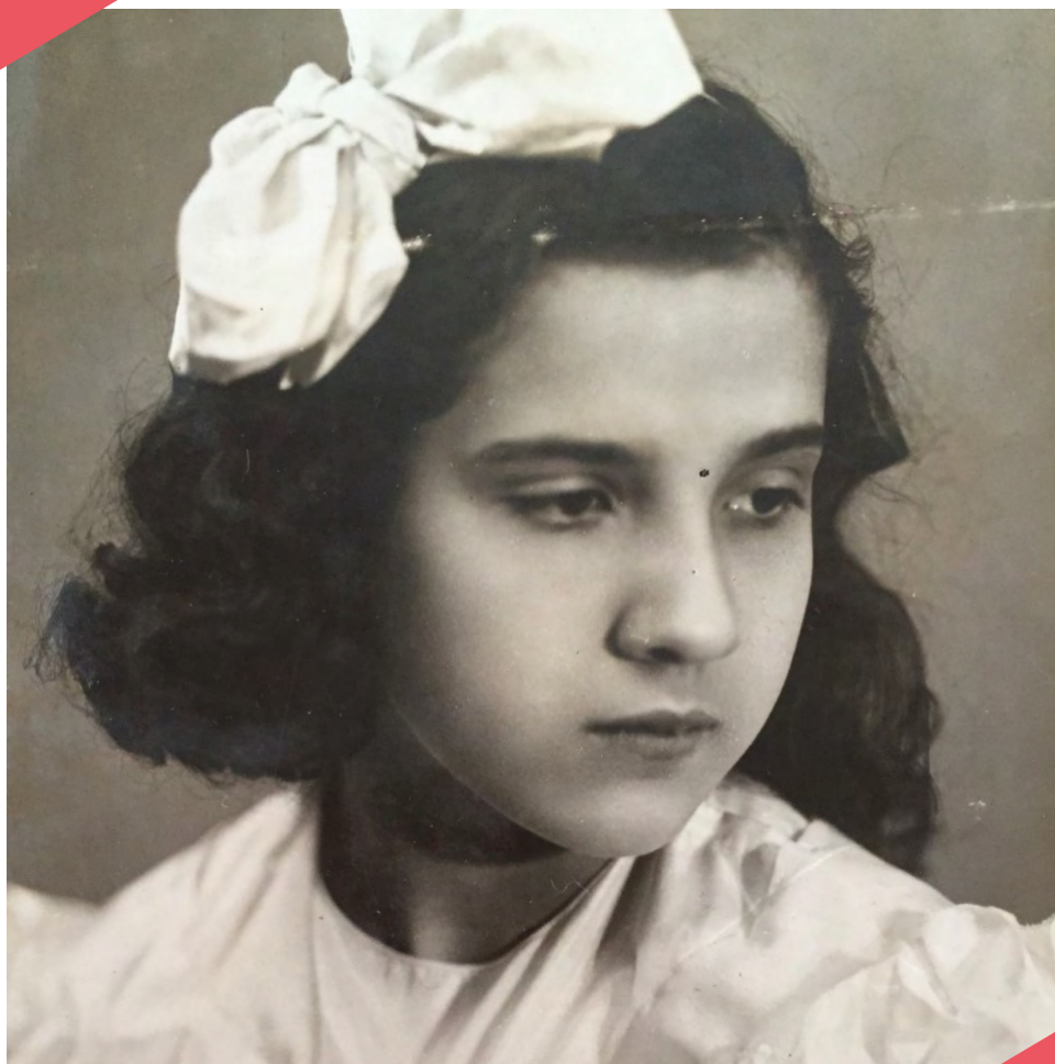
Ida Presti en 1935