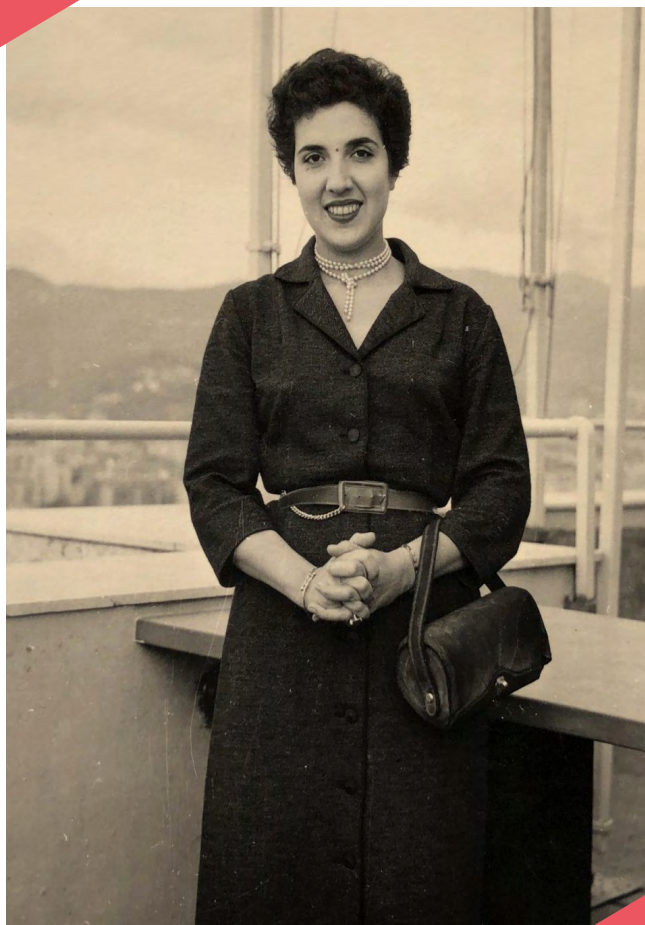
Ida Presti dans les années 60