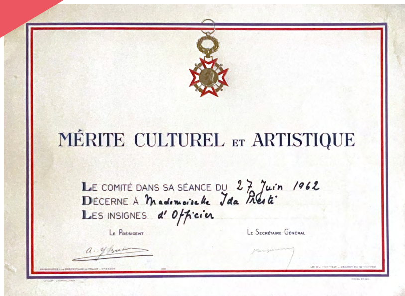
Attestation d'officier du mérite culturel et artistique