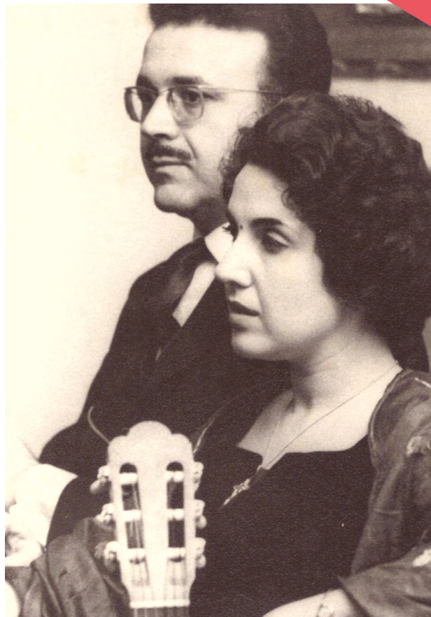
Ida Presti et Alexandre Lagoya dans les années 50